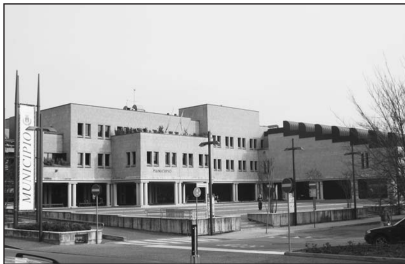
Il municipio dovrebbe essere la sede del confronto e della democrazia.

una opportunità per coinvolgere tutti i cittadini nel seguire l'indirizzo che l'Amministrazione intende adottare per le singole risposte.