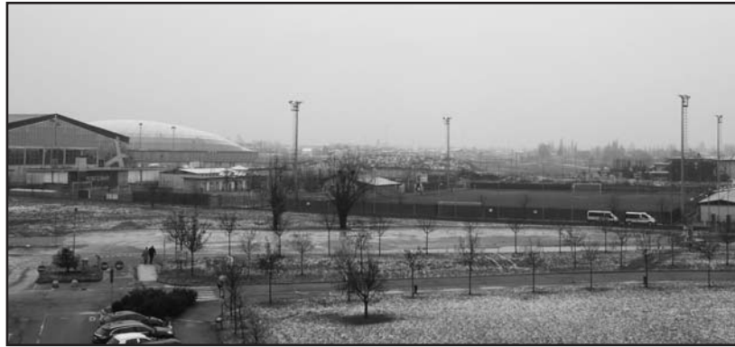
Il centro sportivo Montichiarello.