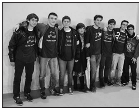
La squadra del don Milani.