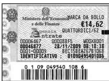
Osservazioni al PGT: chi ha ragione sulla marca da bollo?

Ora sono al vaglio le oltre 250 osservazioni pervenute per tempo (rimane aperta la questione della marca da bollo da apporre sulla domanda, ma questa è un'altra storia)